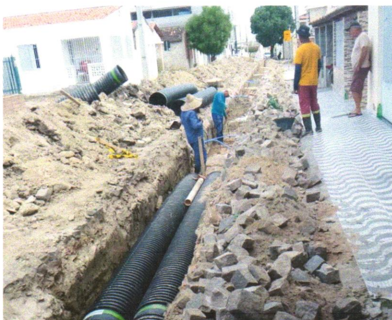
Foto 03 - ESCAVAÇÃO DE VALA