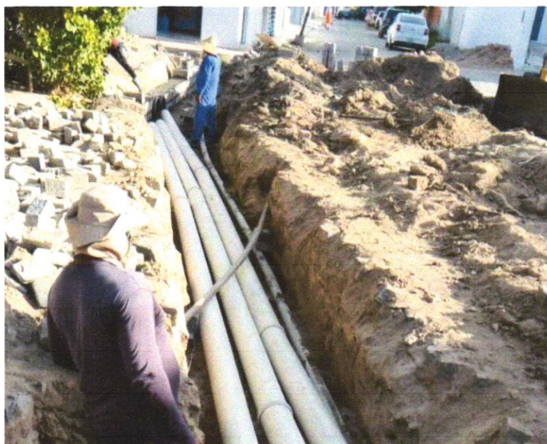
Foto 11 - TUBOS.