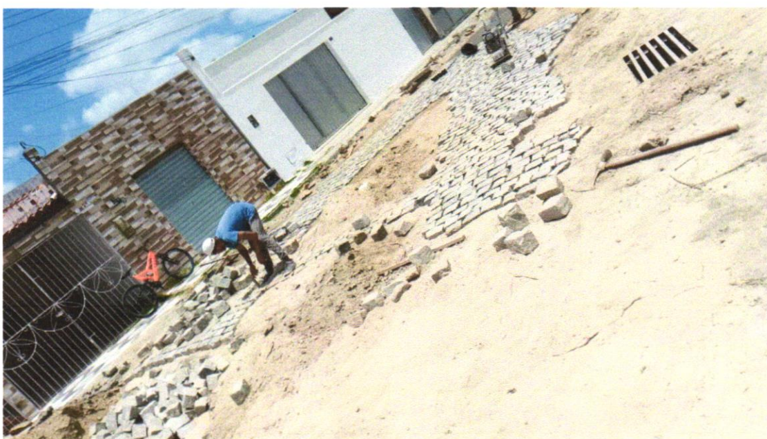
Foto 05 - ATERRO MANUAL COM SOLO ARGILLO-ARENOSO IMPORTADO E COMPACTAÇÃO MECANIZADA EM CAMADAS DE 0,20 M NO MÁXIMO