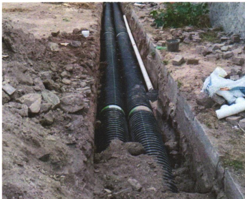
Foto 13 - TUBOS.