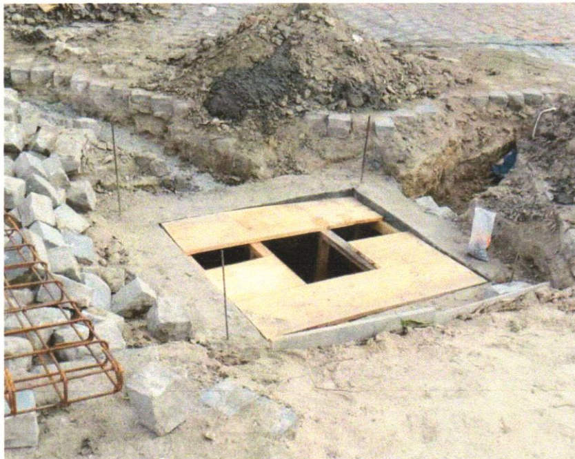
Foto 16 - CAIXAS.