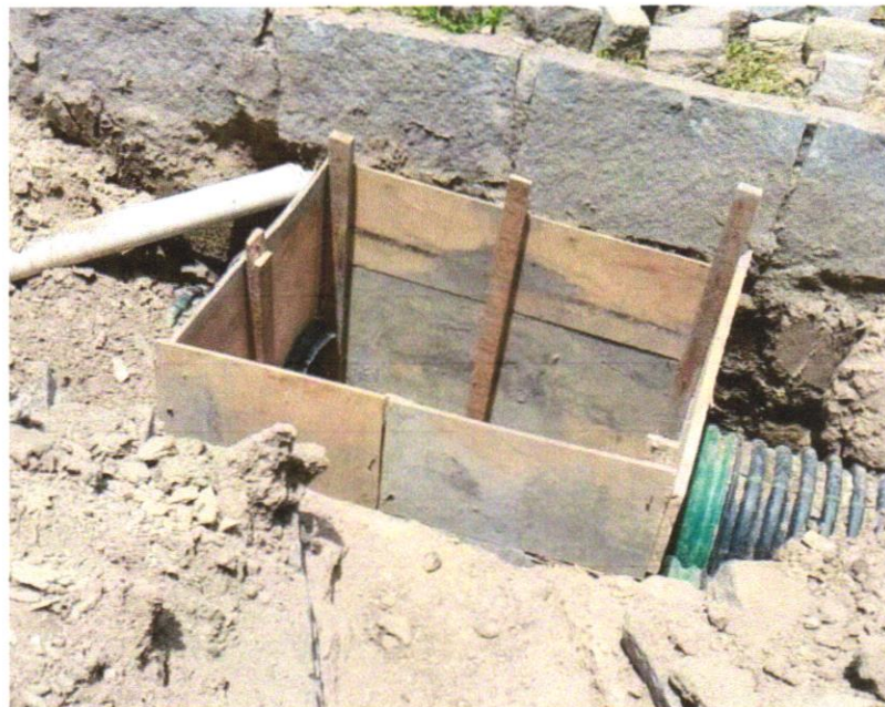
Foto 18 - CAIXAS.