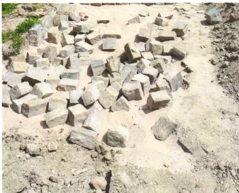
Foto 04 - ATERRO MANUAL COM SOLO ARGILO-ARENOSO IMPORTADO E COMPACTAÇÃO MECANIZADA EM CAMADAS DE 0,20 M NO MÁXIMO