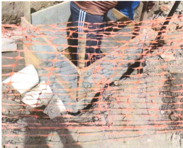
Foto 01 – Tapume de proteção em tela de polietileno h=1,20 com bloco de concreto