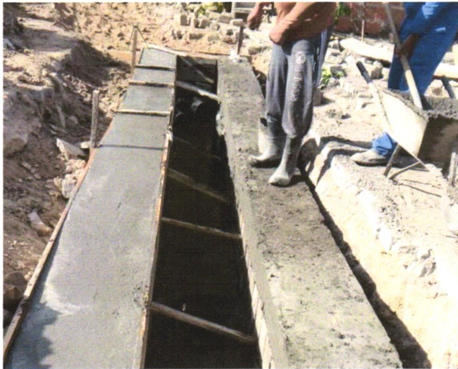
Foto 09 - CONCRETO